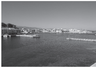
ヴェネツィア港と旧市街

クレタ島は地中海に浮かぶ島で、ギリシャで一番大きい島です。ハニアはそのクレタ島で2番目に大きい都市で、島の北西部に位置しています。旧市街にはヴェネツィア時代の歴史的建造物が多数残っており、名所となっています。