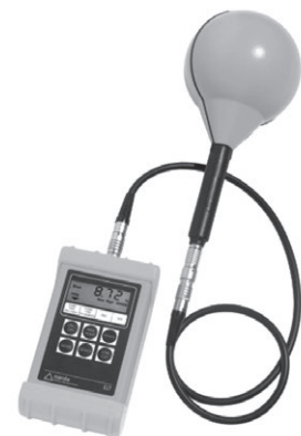
図3 使用した磁界測定器 (Narda S.T.S.社製 ELT-400)

測定方法は、JIS C 1912 (IEC 62233)に準拠し、測定距離は通常の使用法に基づいて、首に掛けて身体に触れた状態で使用する機種は0cm、手で持って身体から離して使用する機種は10cmで測定を行いました。また、ハンディファンの出力切替を最大風力にして測定しました。